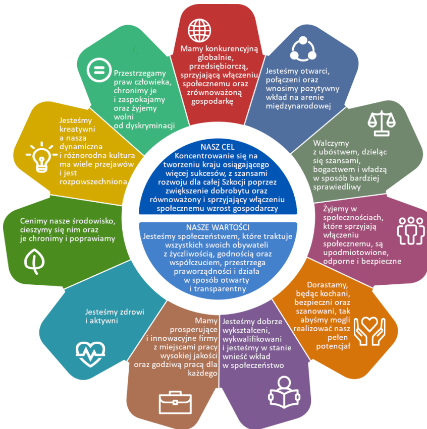
Rysunek 1 Określenie celu przez rząd szkocki