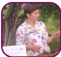
Agroleśnictwo w Dolinie Zielawy